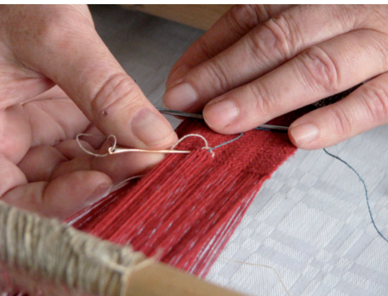
Der Eintrag des Musterfadens während der Herstellung des Grundgewebes. Weaving in the pattern yarn while producing the basic fabric.

Die Textilarchäologie und andere historische Wissenschaften leiten ihre Erkenntnisse von der Dokumentation und Interpretation sicht- und messbarer Merkmale ab. Die dabei gewonnenen Erkenntnisse sind bruchstückhaft, unter anderem weil bestimmte Merkmale, aufgrund mangelnden Wissens über die Herstellungsvorgänge, nicht erkannt werden. Im textilen Bereich betrifft dies unter anderem die Auswahl der Faserstoffe, die Farbstoffverfahren, die Beschaffenheit der Spinn- und Webgerätschaften oder die Wahl der Herstellungstechniken. Forschungen der letzten Jahre haben ergeben, dass die soziologische Bedeutung der Textilien nicht nur vom Ergebnis der Herstellungsvorgänge abhängt, sondern auch durch diese definiert wurden. Das heißt, nicht nur das Aussehen der Textilien zählte, sondern ebenso auf welche Art ein Gewebe hergestellt wurde. Ohne die Versuche der Experimentellen Archäologie bleiben archäologische Textilien in vielen Bereichen stumm.